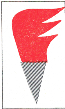
O 4b Označenie vozidla s horľavým nákladom