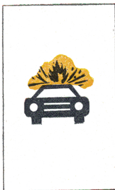
O 4a Označenie vozidla s výbušným nákladom