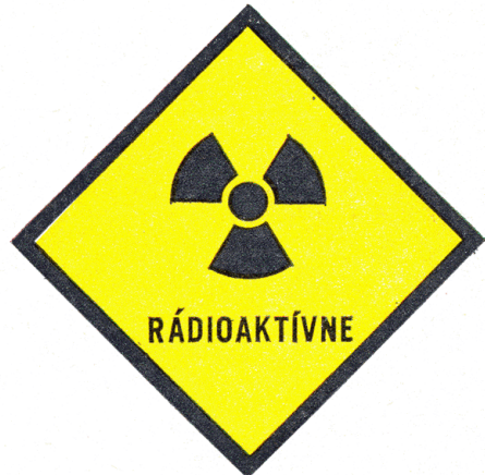
O 4c Označenie vozidla s rádioaktívnym nákladom