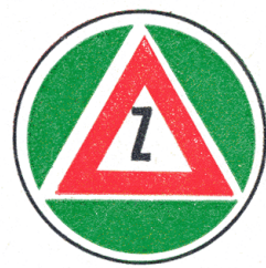
O 3 Označenie vozidiel začiatočníkov