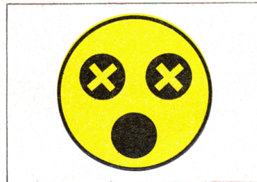
O 1c Označenie na náramenných páskach alebo terčíkoch slepých osôb