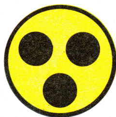
O 2b Označenie vozidiel vedených hluchými osobami