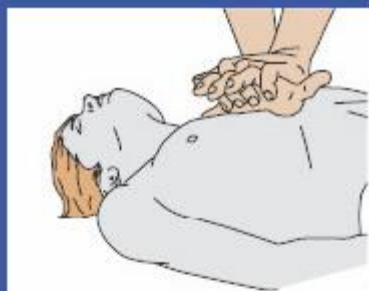
Stlačenie hrudníka 30x : Vdychy 2x